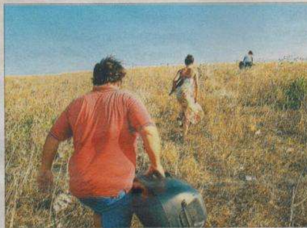
Imatge de l'obra Himno nacional , de Fermín Jiménez Landa, que es pot veure a l'exposició

nitat de tenir una exposició individual al Centre d'Art Lo Pati durant la programació del 2013. El títol de l'obra fa referència a la quantitat de metres quadrats que ocupen els centres d'internament per a estrangers que existien arreu d'Europa.