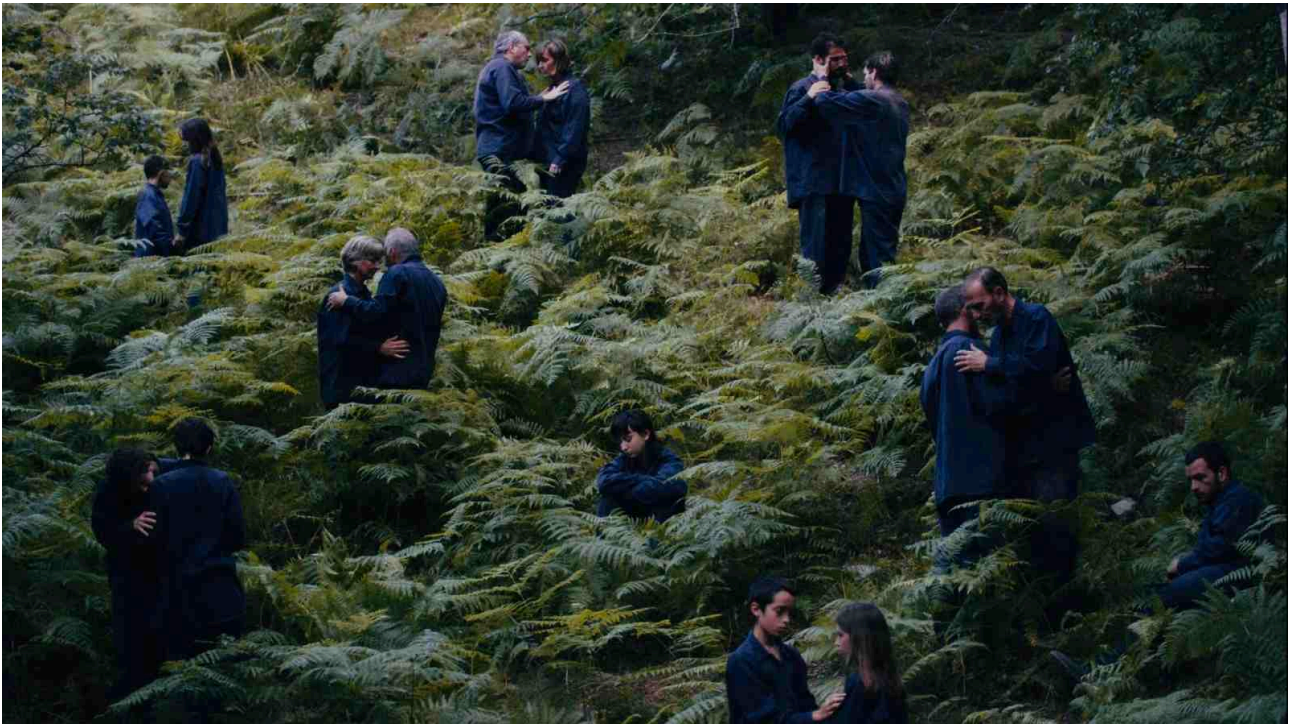
Fotograma de 'The Human Hibernation'

Estrenat al Berlinale Forum 2024 , on va rebre el Premi FIPRESCI , el film ha rebut bones crítiques en festivals com SEMINCI , Karlovy Vary , L'Alternativa , Montreal , Mar del Plata o Novos Cinemas . Aquesta pel·lícula futurista i rupturista a parts iguals planteja una distopia catastròfica on els éssers humans hivernen. A partir de la desaparició de l'Erin, un nen que es desperta prematurament de la seva hibernació, la Clara, la seva germana gran, ens conduirà en un viatge de cerca de respostes i de confrontació amb les narratives preestablertes per la societat en què viu. Una societat que hiberna durant els mesos més freds de l'any. Una reflexió sobre l'ésser humà, la seva contradicció i la condició animal.