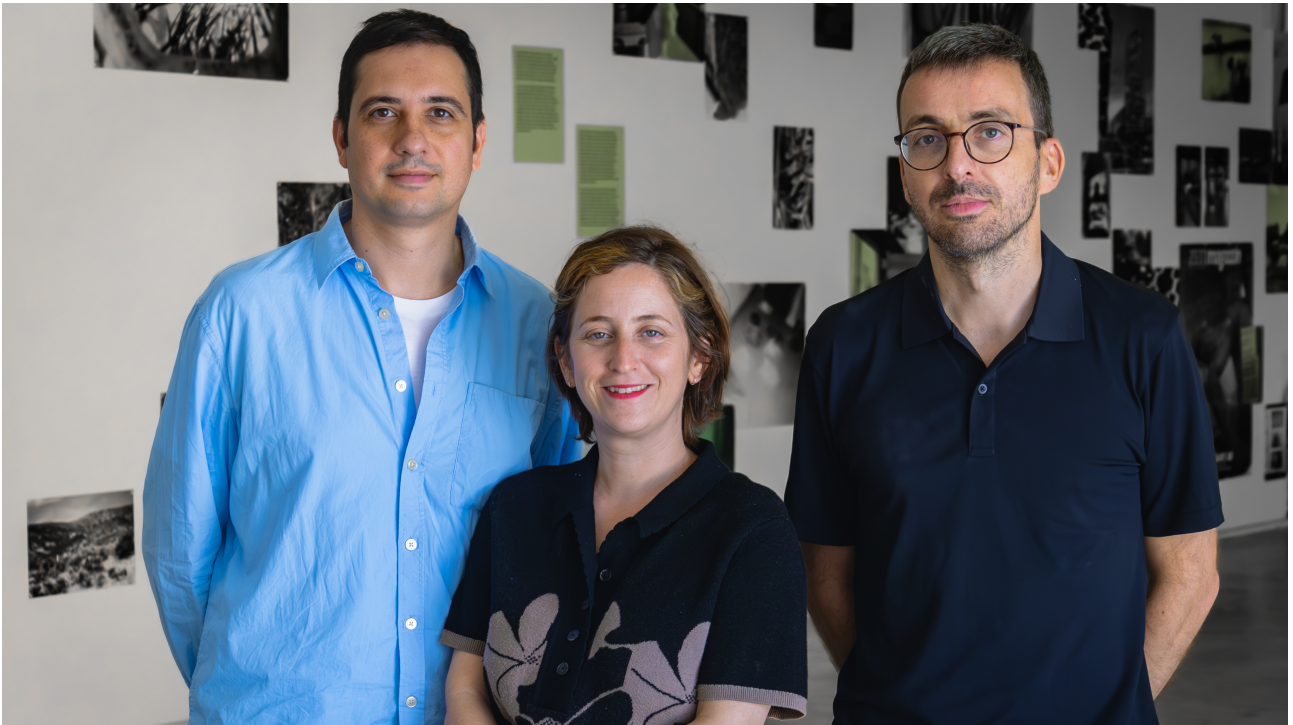
Equip d'artistes de Garba

finalment, presentar els resultats. Així, durant tot aquest període, Garba ha realitzat tallers oberts a la ciutadania i presentacions públiques que culminaran en una acció final a la Residència d'Artistes Baladre , ubicada al nucli de Balada (en ple Delta de l'Ebre) i gestionada per Lo Pati . Entre les activitats de cloenda destaca el taller creatiu amb June Crespo (Pamplona, 1982), una artista amb una obra àmplia que abasta disciplines com la litografia, el dibuix i l'escultura, utilitzant materials diversos com teles, formigó, fibra de vidre, guix i cera. Les seves creacions es troben en col·leccions de museus com l' Artium Museoa i el Museo Reina Sofía . Al llarg de la seva carrera, ha rebut reconeixements com el Premi Gure Artea del Govern Basc el 2013, el Premi El Ojo Crítico de RNE d'Arts Plàstiques el 2018 i el Premi Internacional d'Art de la Fundación María José Jove el 2019. La seva obra es caracteritza per una exploració profunda de la forma i el material, creant escultures que desafien les percepcions tradicionals i conviden a una reflexió sobre la corporeïtat i l'espai.