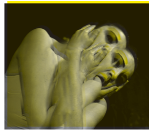
Diumenge 24 / 19.00h Grito de Mujer entre los Muertos Performance