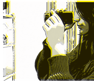
Diumenge 24 / 11.00h Microvisuals Projecció

Projecte desenvolupat amb col·laboració d'un centre educatiu d'Amposta. A partir de la càmera i el muntatge, un grup d'alumnes de primer de batxillerat artístic de l'Institut Ramon Berenguer IV, sota el guiatge de Núria Arias, es plantegen com es construeix el coneixement i quins personatges rellevants han quedat ocults en la narrativa històrica. Quina és l'objectió d'Ada Lovelace? Quin secret amaga la pel·lícula Big eyes? Per què una escriptora signa amb un nom masculí? Per què van matar a Hipàtia d'Alexandria? Després de la projecció de les seves peces audiovisuals hi haurà espai per al diàleg.