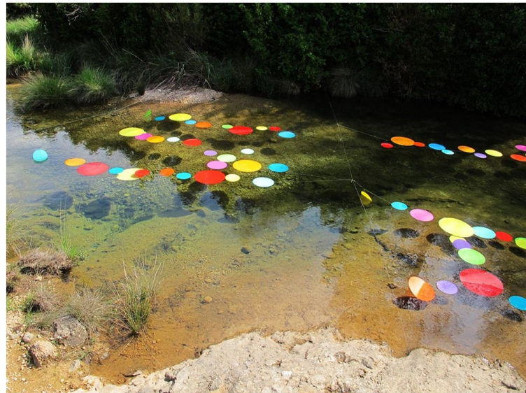
Dissabte 2 i diumenge 3 de juny 2018.